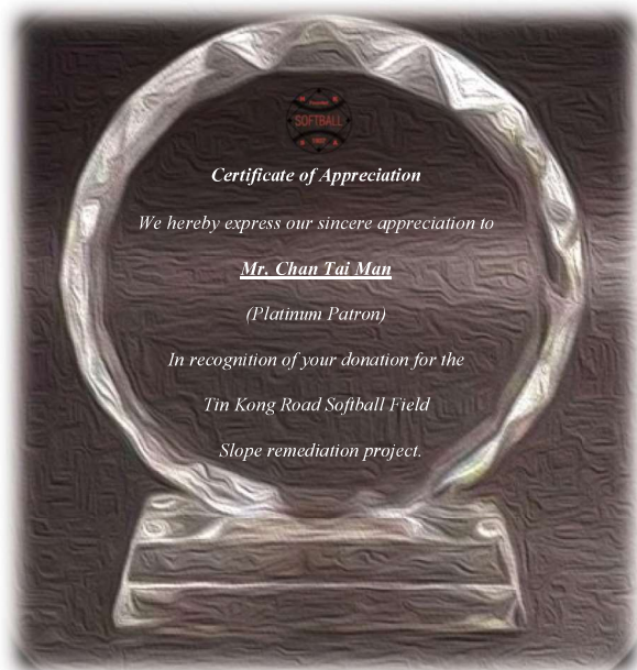
註三：鳴謝牌匾設計概念圖